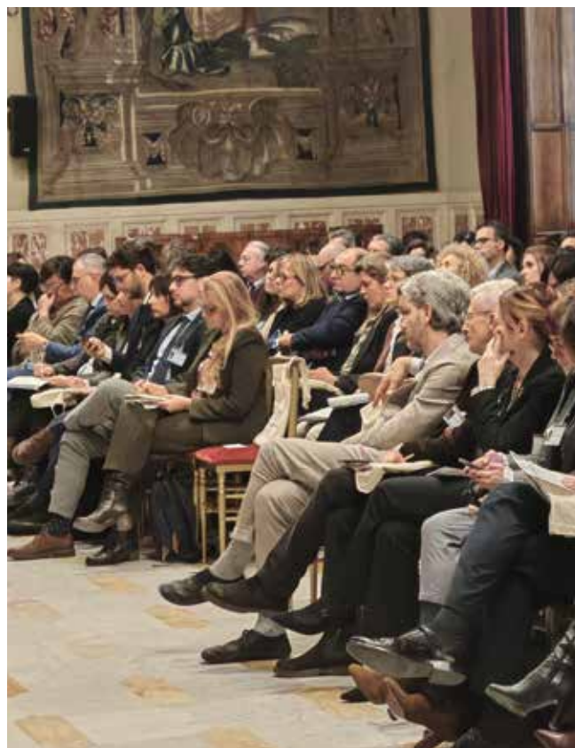
L'articolo è tratto dall'intervento di Massimo Temussi, Direttore Generale - Ministero del Lavoro e delle Politiche Sociali, ed è stato rielaborato dalla Redazione. Il testo non è stato rivisto dall'autore.

Il sistema delle politiche attive del lavoro ha compiuto un salto di qualità significativo. Ora è il momento di trasformare questa esperienza in un modello duraturo, capace di accompagnare le persone nelle transizioni e di sostenere la competitività del Paese in un contesto in continua evoluzione.