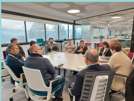
Figura 1. Il Workshop spagnolo

All'inizio del progetto, ogni partner del partenariato ha realizzato dei workshop nazionali in tutti e 5 i paesi europei del consorzio ( Italia, Portogallo, Grecia, Spagna e Slovacchia ).