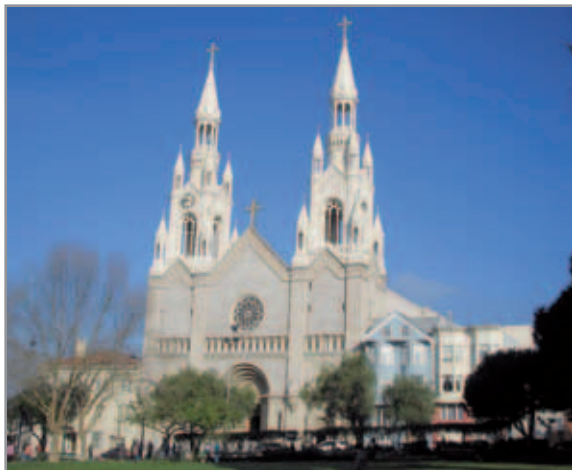
Chiesa Santi Pietro e Paolo, S. Francisco, USA. Prima Chiesa costruita dai Salesiani per gli emigrati italiani

La società di San Francesco di Sales, fondata nel 1859 per l'educazione della gioventù “povera ed abbandonata”, tendeva pure a dare un proprio contributo per la formazione religiosa, morale e culturale delle classi popolari. Fra questi si possono indubbiamente collocare gli emigranti italiani, verso i quali l'attenzione di Don Bosco (1815-1888) andò al momento di inviare missionari in Patagonia nel 1875: “Vi raccomando con insistenza particolare la posizione dolorosa di molte famiglie italiane [...] voi