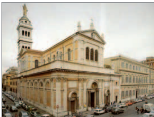
Figura 5. Facciata della Chiesa del Sacro Cuore - Roma

La terza chiesa, che costò a Don Bosco sacrifici enormi, è la basilica romana del Sacro Cuore al Castro Pretorio, voluta da Papa Pio IX e affidata al Nostro da Leone XIII. Il progetto è dell'architetto Francesco Vespignani (1808-1882), figlio di Virginio Vespignani, l'architetto di Pio IX. La facciata della basilica è di schietto gusto neorinascimentale realizzata in mattoni e travertino; i tre portali, in marmo bianco di Carrara, sono coronati da mosaici che raffigurano "Il Sacro Cuore di Gesù, San Giuseppe e S. Francesco di Sales".