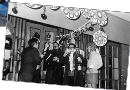
Momenti di attività espressive

“Essendo amati in quelle cose che a loro piacciono, col partecipare alle loro inclinazioni infantili, imparino a veder l’amore in quelle cose che naturalmente lor piacciono poco: quali sono la disciplina, lo studio, la mortificazione di se stessi, e queste cose imparino con amore”.