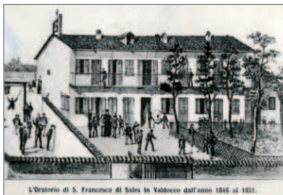
L'Oratorio di S. Francesco di Sales in Valdocco dall'anno 1846 al 1851.

Dal verbale dell’istituzione della Congregazione Salesiana.