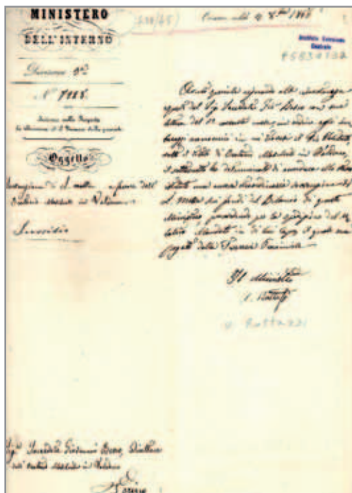
Atto di liberalità da parte del Ministro Rattazzi a favore dell'Oratorio Maschile di Valdocco - 1856

In un breve ma denso saggio, dedicato a Don Bosco e la modernità , Pietro Scoppola scrive che Don Bosco è certamente un personaggio scomodo per gli studiosi di storia, perché non si inquadra facilmente nelle loro categorie. Gli strumenti di analisi sono limitati quando si tratta di attingere al segreto della sua personalità. Del resto questa è una posizione molto comune fra gli storici. Nella sua analisi sull'anticattolicesimo nel periodo risorgimentale Antonio Socci afferma che Don Bosco, che pure si diceva “attaccato a Roma più del polipo allo scoglio”, non fu mai clericopapista o neoguelfo, né ovviamente neoprottestante. Allo stesso modo non fu né liberale né reazionario, né conciliarista, né intransigente, ma fu un fedele seguace di Cristo e della Chiesa.