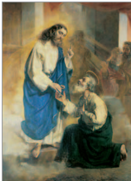
Figura 6. “Consegna della chiavi a San Pietro” di Filippo Carcano, Basilica di Maria Ausiliatrice - Torino

A differenza di altre opere conservate nelle chiese salesiane, il dipinto con la ‘Consegna delle chiavi a San Pietro’ (fig. 6) di Filippo Carcano ha avuto un iter meglio documentato. Trovandosi in difficoltà, Don Bosco si rivolse al duca milanese Tommaso Gallarati Scotti perché gli suggerisse un pittore, in ambito milanese, all'altezza dell'opera che voleva per la chiesa di Maria Ausiliatrice. Il duca gli presentò Filippo Carcano come il più capace interprete delle sue idee. Dopo tante esitazioni il Santo si affidò al buon gusto del Gallarati Scotti. Il quadro era già pronto il 21 aprile 1869; a quella data Don Bosco scrisse da Mornese a don Michele Rua