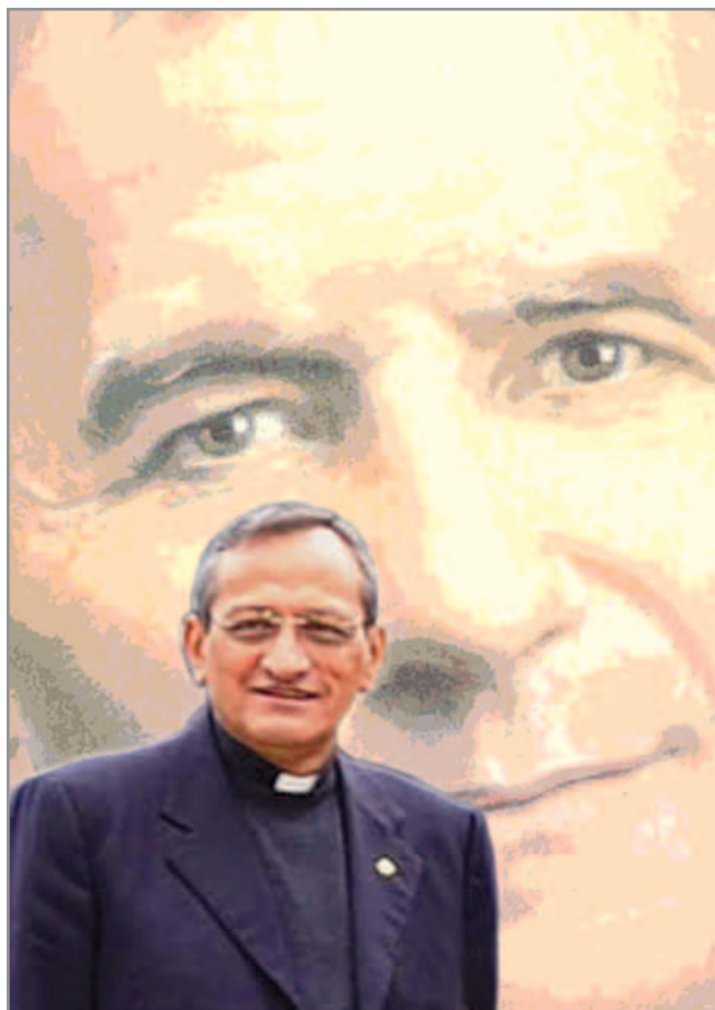
Don Pascual Chávez Villanueva Rettor Maggiore e IX Successore di Don Bosco

“Uno solo è il mio desiderio, quello di vedervi felici nel tempo e nell’eternità”.