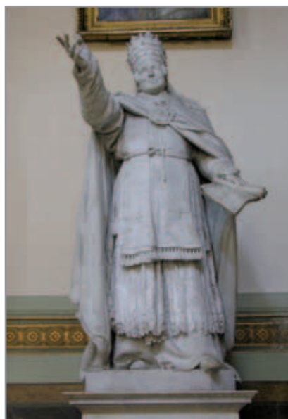
Figura 9. Pio IX, Chiesa del Sacro Cuore - Roma

Le varianti nei tre lavori sono minime: il pontefice, in abiti pontificali, camice, piviale e tiara, con gesto ispirato, alza il braccio destro quasi a confermare un suo intimo pensiero; la mano sinistra regge un rotolo, in parte svolto, che avrebbe dovuto recare inciso il motivo del gesto. Probabilmente autore e committente volevano indicare un momento preciso del pontificato di Pio IX: la proclamazione del dogma dell'Immacolata dell'8 dicembre del 1854. Il volto e il gesto del pontefice