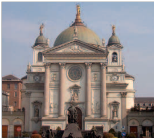
Figura 3. Facciata della Chiesa di Santa Maria Ausiliatrice - Torino