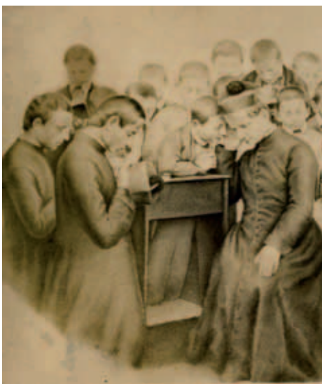
Don Bosco mentre confessa il giovane Paolo Albera, che sarà suo secondo successore

In definitiva, occorre riscoprire e praticare, scrive Pietro Braido, le molteplici accezioni del prevenire oggi: «Tutto potrebbe indurre a un rinnovato approfondimento storico e teorico del “sistema”, non offuscato da attuazioni elitarie o idealizzate. Don Bosco non parte da giovani selezionati né arriva ad essi. La sua esperienza preventiva tende a diventare sistema universale di assistenza, educazione e socializzazione, così com’era stata vista dalla generalità degli osservatori, ammiratori, collaboratori, cooperatori, biografi. Dalla considerazione dei giovani più poveri e più pericolanti egli passa ben presto alla constatazione e alla persuasione che tutti i giovani in quanto tali, non adulti, non autonomi, dipendenti, in certo senso in balia della società (o privi della società civile, i “selvaggi”), sono in qualche modo potenzialmente abbandonati e pericolanti, perché dovunque, a cominciare dall’ambiente teoricamente più affidabile, che è la famiglia, esposti a manipolazioni, trascuratezza, abbandono, indisponibilità fisica o morale, insufficienze. Per tutti, perciò, in diverse misure educare potrà significare prevenire, in tutte le possibili accezioni; e prevenire potrà a sua volta significare recuperare, ricostruire, rieducare, correggere e addirittura “reprimere”, se ciò si rivelasse terapeuticamente produttivo. Se il chicco di grano non muore...».