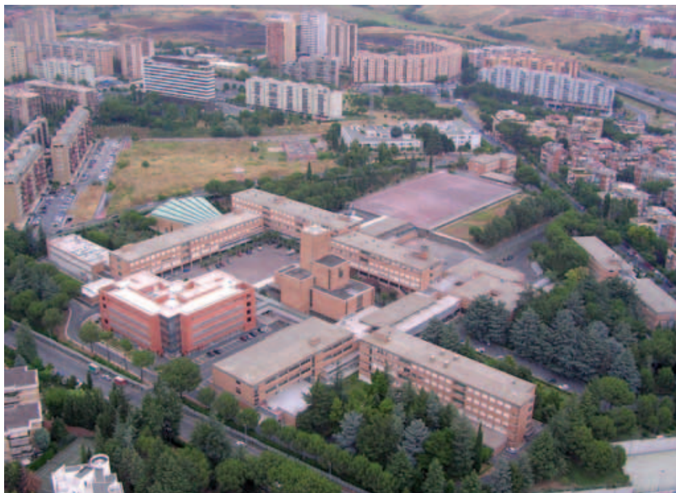
Veduta dall'alto dell'Università Pontificia Salesiana