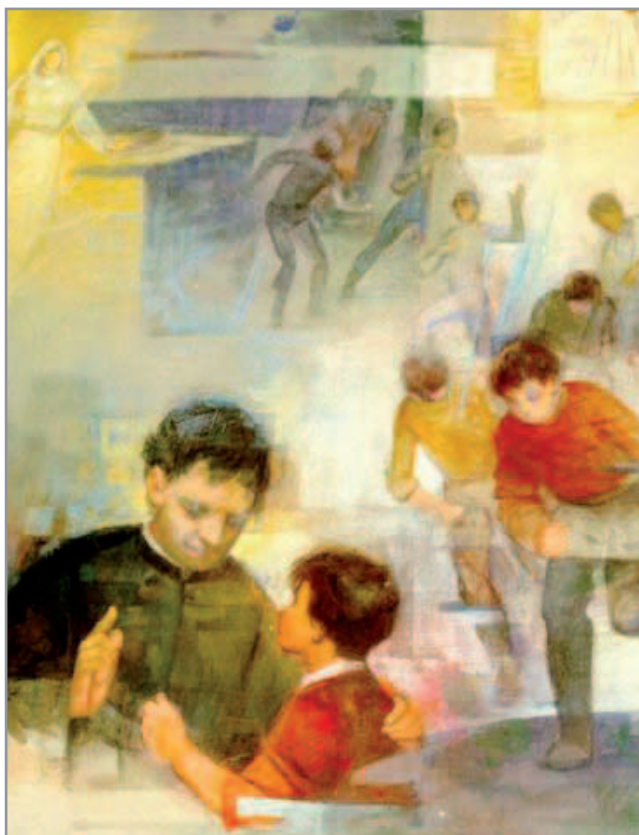
Don Bosco e le arti espressive.

In questa sezione vengono riportate quelle attività e iniziative attraverso le quali Don Bosco, a partire dalle sue capacità comunicative ed espressive, aiutava i ragazzi a tirare fuori il meglio di sé, esprimendo emozioni, valori...in un clima di gioia.