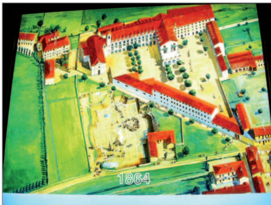
Disegno dell’oratorio di San Francesco di Sales - Torino Valdocco nel 1864

In una realtà sociale così complessa e “plurale”, sono oltremodo necessarie istituzioni educative che sappiano accompagnare con serenità e lungimiranza le nuove generazioni incontro alla vita. L’oratorio salesiano è fra queste. Non ha esaurito la sua funzione, anzi... Oggi, di nuovo, è sollecitato a interpretare in modo storicamente adeguato il proposito di Don Bosco di formare “buoni cristiani e onesti cittadini”. Di persone così ha bisogno la Chiesa, ha bisogno il nostro Paese, che, centocinquanta anni dopo l’Unità, si trova alle prese con un cumulo enorme di problemi, per giunta, senza avere davvero elaborato il senso di una condivisa appartenenza nazionale.