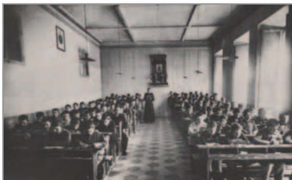
Il famoso “studio” ai tempi dei collegi

Don Bosco sentì il bisogno di alfabetizzare ragazzi e adulti che accoglieva perché, non essendo essi spesso in grado di leggere (e scrivere), non riuscivano a seguire con frutto le lezioni di catechismo che egli impartiva. Una lezione, che si doveva ridurre alla pura trasmissione orale, per lui era infruttuosa.