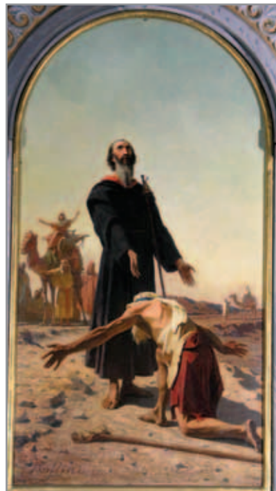
Figura 7. “Sant'Antonio abate” di Giuseppe Rollini, Chiesa di San Giovanni Evangelista - Torino

La tela, firmata e datata 1882, si trova ancora sull'altare dedicato al santo nella chiesa di San Giovanni Evangelista.