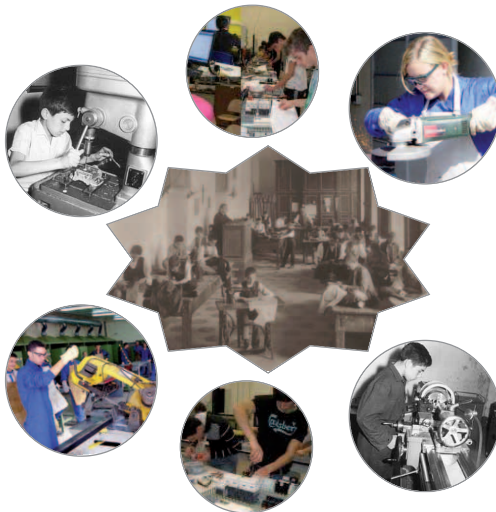
Alcune evoluzioni dei diversi laboratori professionali

“più convincente documentazione” sulla formazione professionale ricevuta dalla gioventù operaia “rimarrà sempre dispersa nei cantieri più remoti e nelle più impensate officine della terra. Là, ove sono migliaia di lavoratori cristiani, mai raccolti in una cifra statistica: operai che hanno imparato fin dalla giovinezza a scoprir sotto la fatica una gioia, e sotto la gioia uno spirito, e, oltre lo spirito, il Dio della giustizia e della pace”.