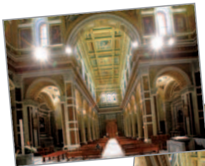
Interno della Chiesa del Sacro Cuore - Roma