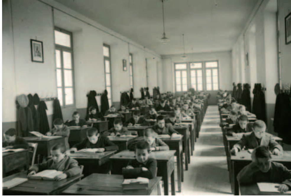
Collegio di Mirabello - 1940

“L’educatore è un individuo consacrato al bene dei suoi allievi, perciò deve essere pronto ad affrontare ogni disturbo, ogni fatica per conseguire il suo fine, che è la civile, morale, scientifica educazione de’ suoi allievi”.