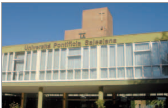
Università Pontificia Salesiana - Roma

Una delle opere più impegnative della Congregazione Salesiana è l'Università Pontificia Salesiana (UPS) che ha la sua sede a Roma in Piazza Ateneo Salesiano, 1. In essa operano circa cento docenti universitari salesiani impegnati a tempo pieno, affiancati da circa duecento docenti laici coinvolti in corsi, seminari e tirocini, oltre a un numeroso personale tecnico che collabora nei