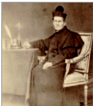
Don Bosco nella sua camera - Torino 1861

Le Letture Cattoliche, la Storia d'Italia, la Storia Sacra, la grande attività editoriale di Don Bosco, il teatro, la musica, il cinema, il recital, il sistema metrico decimale hanno fatto di Don Bosco uno dei più attivi divulgatori e formatori, specie a livello popolare.