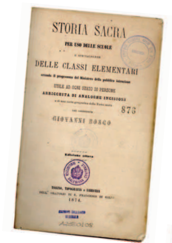
Alcuni tra i libri scritti da Don Bosco per i suoi ragazzi