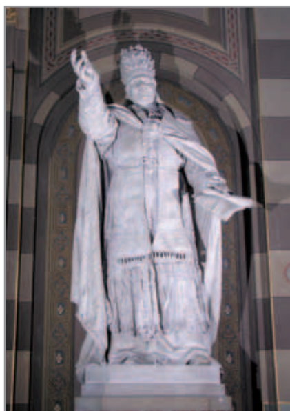
Figura 8. Pio IX, Chiesa di San Giovanni Evangelista - Torino

Il Confalonieri era nato a Costa Masnaga nel 1850 e studiò a Brera sotto la guida di Vincenzo Vela. Partecipò a numerose esposizioni nazionali e internazionali e si specializzò nella produzione di monumenti commemorativi, spesso segnati dal gusto per il colossale. Elaborò anche, con grande interesse, il tema del monumento funebre. Morì a Milano nel 1925.