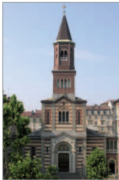
Figura 4. Chiesa di San Giovanni Evangelista - Torino

L'architetto disegnò una chiesa ispirandosi a modelli romanici lombardi del XIII secolo, rivisitati con mentalità che aderiva ai canoni storiografici dell'ottocento. L'alta guglia che sovrasta la porta principale, in mattoni profilati da cemento e pietra, è inusitata nel panorama architettonico torinese e piemontese ( fig. 4 ).