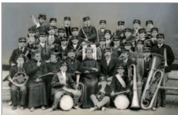
Don Bosco in mezzo agli allievi della banda musicale - Torino 1870

Il canto, la musica sono presenti all'oratorio di Don Bosco sin dagli inizi e con una doppia funzione. Prima di tutto, come forma di preghiera, di arricchimento delle funzioni liturgiche durante la Santa Messa. Poi, viene la musica come ambiente ricreativo ed educativo allo stesso momento, musica come comunicazione e richiamo di attenzione del pubblico.