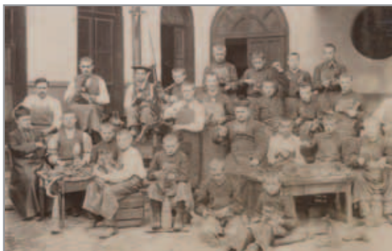
Laboratorio dei calzolari

Il noto biografo e memorialista salesiano, Eugenio Ceria, comincia un capitolo della sua voluminosa opera, Annali della Società Salesiana (1941-1951), con una attenta dichiarazione: “Per misurare tutta la portata delle scuole professionali di Don Bosco bisognerà aspettare di vederne il meraviglioso sviluppo nell’antico e nel nuovo Continente sotto i successori del Santo, egli