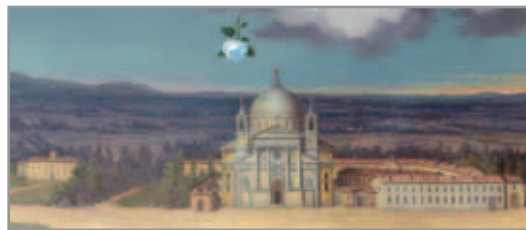
Figura 2. Dipinto dell'altare di San Giuseppe, Chiesa di Santa Maria Ausiliatrice - Torino

Dopo aver acquistato il terreno Don Bosco radunò una commissione di architetti per studiare il da farsi. Dopo lunghi scambi di vedute, Don Bosco tagliò corto e affidò l'incarico di preparare i progetti della chiesa all'ingegnere Antonio Spezia (1814-1892), con il quale era in amichevoli rapporti fin dai primi tempi dell'oratorio. I cinque progetti di massima per la nuova chiesa furono presentati all'ufficio comunale competente datati 14 maggio 1864. La facciata della chiesa (fig. 3), nonostante alcuni interventi successivi che l'hanno