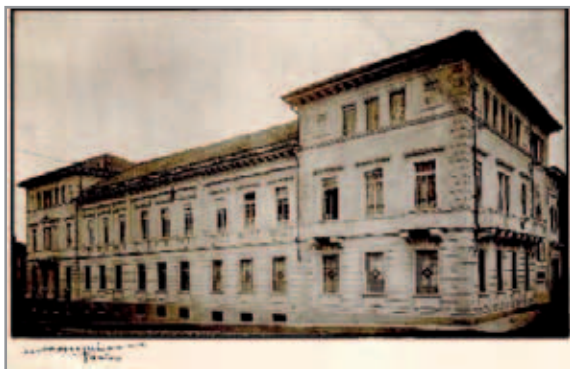
Sede Società Editrice Internazionale - SEI

Da cento anni la Società Editrice Internazionale (SEI) accompagna l'evolvere della scuola italiana. Fondata il 31 luglio del 1908, per impulso dell'allora Rettor Maggiore il beato Michele Rua, ad opera di un gruppo di Cooperatori salesiani italiani e stranieri, come Società Anonima Internazionale per la Diffusione della Buona Stampa (SAID), il 19 agosto 1920 con delibera dell'Assem-