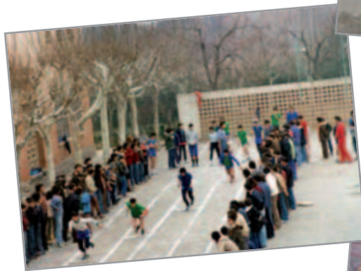
Immagini di vita oratoriana