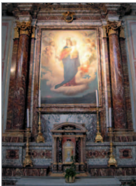
Altare di Maria Ausiliatrice, Chiesa del Sacro Cuore - Roma

Celebrando a questo altare, alcuni mesi prima della sua morte, Don Bosco comprende tutta la sua vita, così come gli aveva promesso la Maestra nel sogno dei nove anni: “A suo tempo tutto comprenderai”.